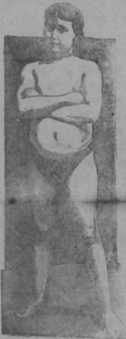
EDAD 11 AÑOS

La transformación maravillosa de un sér endeble y raquítico en un adolescente fuerte, robusto y sano, como lo demuestra su atlética figura, fué obra realizada por la